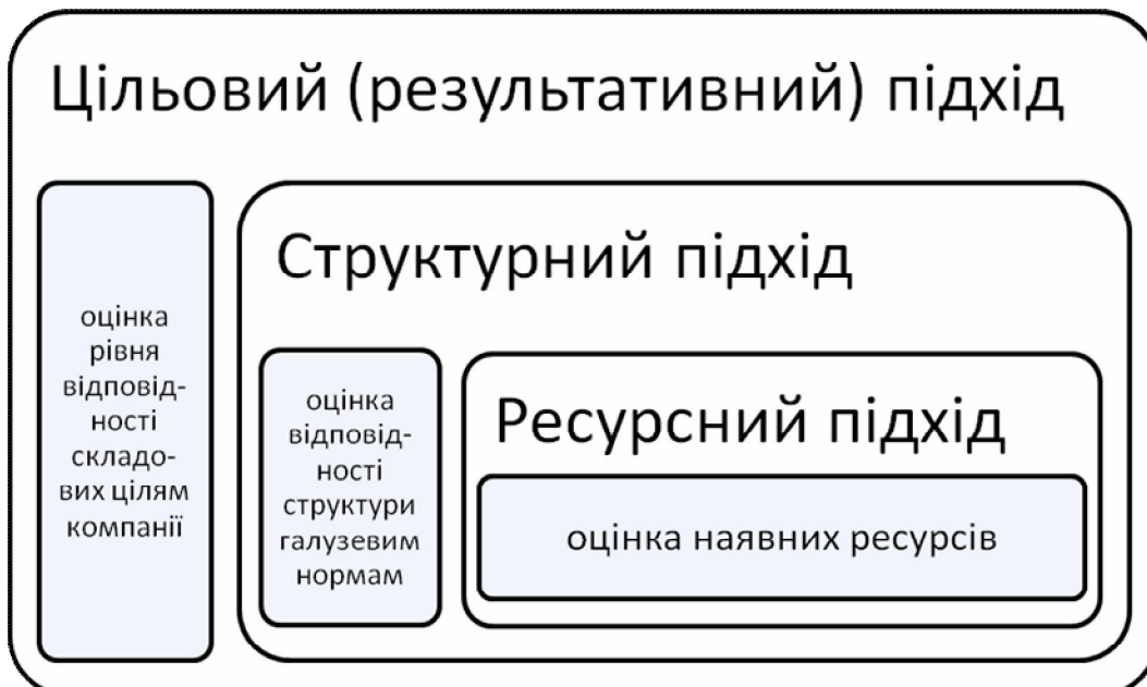
Рис. 3. Зміст основних підходів до оцінки економічного потенціалу ТЕК

Для оцінки економічного потенціалу підприємства використовують різні підходи. Найбільш розповсюджені наведені на рис. 3.