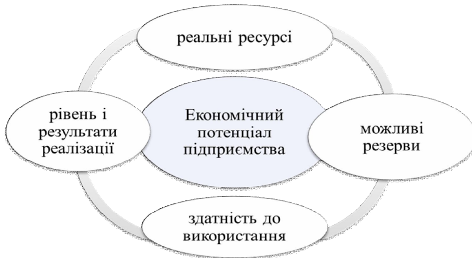
Рис. 1. Сукупність характеристик для дослідження економічного потенціалу підприємства

Дослідження економічного потенціалу проводяться в рамках класичних методик. Причина різноманіття підходів до оцінки економічного потенціалу міститься в наявності багатьох різних трактуваннях категорії «економічний потенціал».