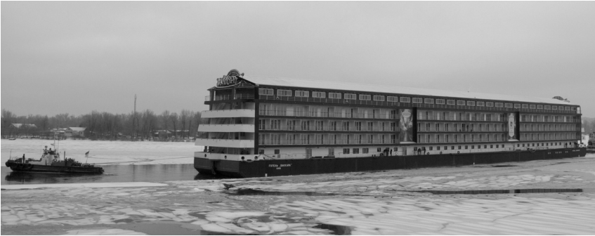
Рис. 3. Плавучий железобетонный отель «Баккара» (Киев). Построен на Херсонском государственном заводе железобетонного судостроения «Паллада».

использования железобетонного судостроения может являться плавучий отель «Баккара», построенный на Херсонском государственном заводе железобетонного судостроения (рис.3)