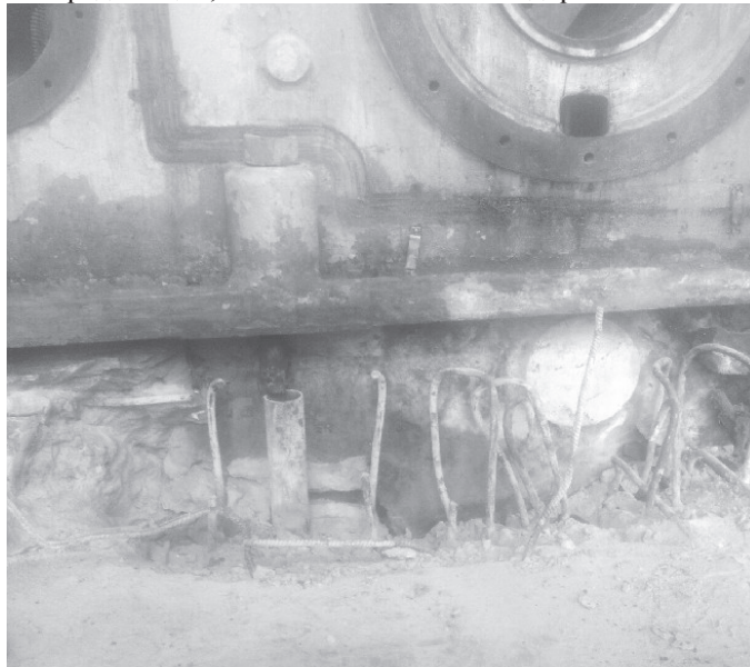
Рис. 2. Вплив агресивного середовища на анкер

Базальтопластикова арматура може бути рекомендована для використання в конструкціях при будівництвах, відновленні, ремонті, реконструкції чи модернізації будівель та споруд з агресивним навколишнім (мал. 2) та внутрішнім середовищем, особливо на хімічних підприємствах.