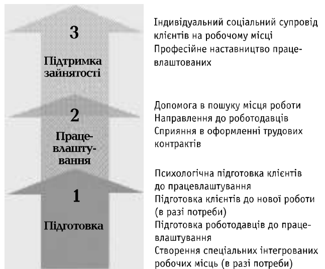
Рис. 1. Етапи "зайнятості із підтримкою"

Виклад основного матеріалу. Насамперед зауважимо, що однією із важливих концепцій сучасної соціальної роботи та соціології зайнятості можна вважати "зайнятість із підтримкою" (supported employment). Це поняття вживають на позначення системи підтримки осіб із проблемами здоров'я для забезпечення їх зайнятості на інтегрованому ("звичайному", тобто не спеціально облаштованому для інвалідів) робочому місці, яка охоплює: створення можливостей для працевлаштування, спеціалізовану підготовку до працевлаштування, індивідуальну професійну соціальну підтримку та наставництво працевлаштованих осіб з метою збереження зайнятості. Впровадження концепції зайнятості із підтримкою дає змогу індивідам з особливими потребами та певними розладами здоров'я залишатися активними суб'єктами ринку праці, що мають власний прибуток від праці і не залежать тільки від соціальних виплат держави [9]. Система підтримки за цією концепцією складається з кількох етапів (рис. 1).