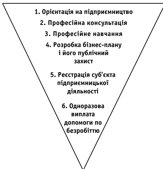
Рис. 1. Компоненти системи залучення і підготовки безробітних до підприємницької діяльності

Для сприяння працевлаштуванню таким безробітним шляхом відкриття власної справи у базових центрах зайнятості організована системна робота. Процес залучення до підприємництва і самозайнятості охоплює шість