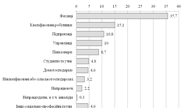
Рис. 1. Структура середнього класу за соціально-професійними групами у 2014 р., %

Охоплюючи різні соціальні групи, середній клас є неоднорідним, або гетерогенним. В його структурі можна виокремити верхні, середні та нижні прошарки (принаймні за доходами), а також частини так званих старого і нового середнього класів.