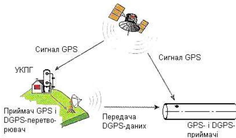
Рисунок 2 – Метод диференційованої корекції DGPS

до того моменту, поки не зведе усі виміри до однієї точки. Таким чином, чим більше підключено до виміру супутників, тим точнішими будуть виміри.