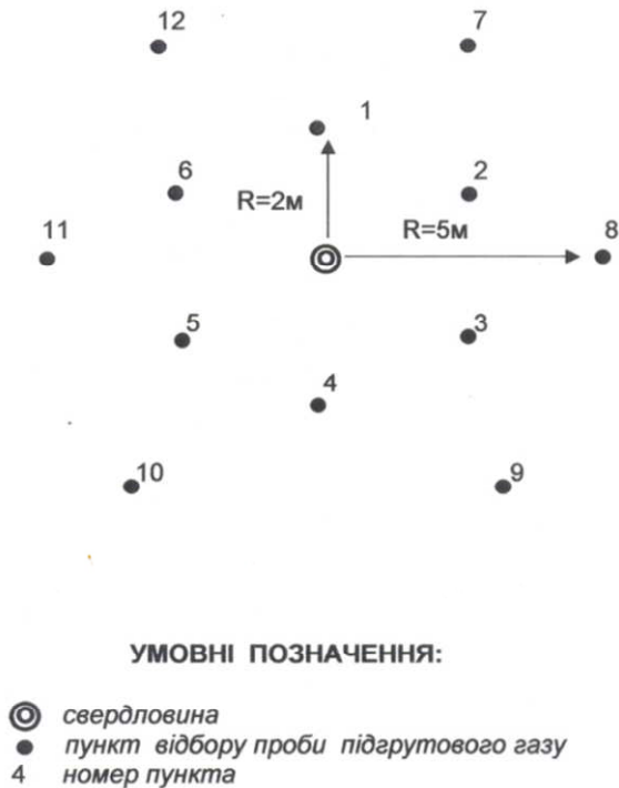
Рисунок 3 – Схема розташування пунктів відбору проб підґрунтового газу біля устя свердловини

двоколову (на відміну від існуючої хрестоподібної) систему розташування пунктів відбору проб з радіусами кіл 2 і 5 метрів і шістьма пунктами відбору проб на кожному колі (рис. 3). Для просторової прив'язки пунктів відносно гирла свердловини перший пункт ближнього кола завжди розташовується у північному напрямку. Решта п'ять пунктів – за годинниковою стрілкою у вершинах вписаного в коло шестикутника. Пункти 7-12 більшого кола радіально зміщуються відносно меншого кола на 30° за годинниковою стрілкою, що дає змогу збільшити площинну густоту досліджень.