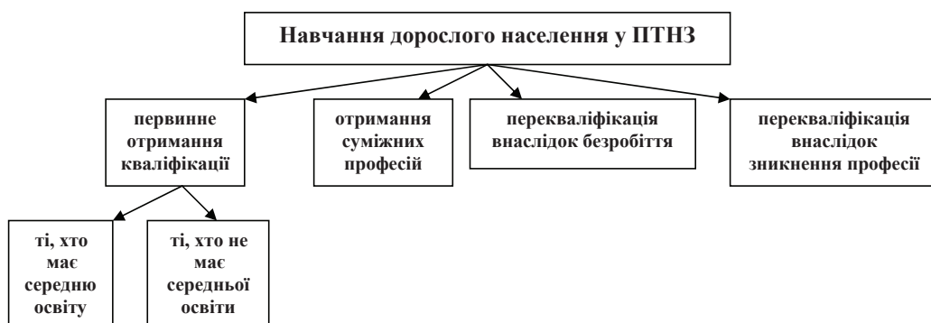
Рис. 1. Навчання дорослого населення (за соціальним статусом)

Отже, по-перше, навчання дорослого населення нерозривно пов'язане з побудовою громадянського суспільства, але для цього необхідно створити відповідні умови, а саме – нормативно-правову базу через розроблення державних