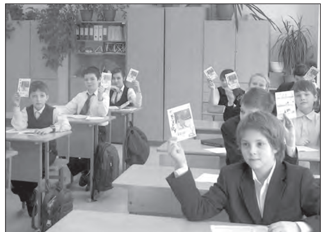
Учні гімназії – активні учасники Міжнародного математичного конкурсу «Кенгуру»

Велику увагу приділяємо атестаційному періоду учителів, коли відбувається узагальнення досвіду роботи та результатів діяльності за звітний період. Самоосвітня діяльність кожного вчителя – найважливіша складова його професійного зростання. Більше того, творчі вчителі беруть участь і в науково-дослідній, аналітичній роботі, зокрема, це робота над проблемною темою гімназії «Розвиток творчого потенціалу дитини з урахуванням її