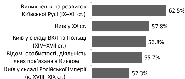
Рис. 2. Результати виконання завдань тесту за навчальними темами

та «Київ у XX ст.» (57,8%). Гірше сформовані знання, вміння і навички з теми «Київ у складі Російської імперії (кінець XVIII–XIX ст.)» (52,3%). Імовірно, це пов'язано з тим, що в Києві збереглася велика кількість історичних пам'яток періоду Давньої Русі порівняно з пам'ятками кінця XVIII–XIX ст. (див. рис. 2).