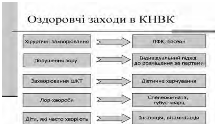
Рис. 4. Система оздоровчих заходів у Красноармійському навчально-виховному комплексі

Надзвичайно важливою є психічна складова здоров'я . З учнями, їхніми батьками, педагогами КНВК проводиться просвітницька, консультативна робота у різних формах: публічні виступи психологів на годинах спілкування, батьківських зборах, методичних нарадах, конференціях, тренінги, виховні заходи з розвитку класних учнівських колективів. Привертають увагу матеріали інформаційного куточка «ПсихоHELP». Корекційно-розвивальна та профілактична робота психологічної служби КНВК побудована на основі аналізу моніторингових досліджень за напрямками: