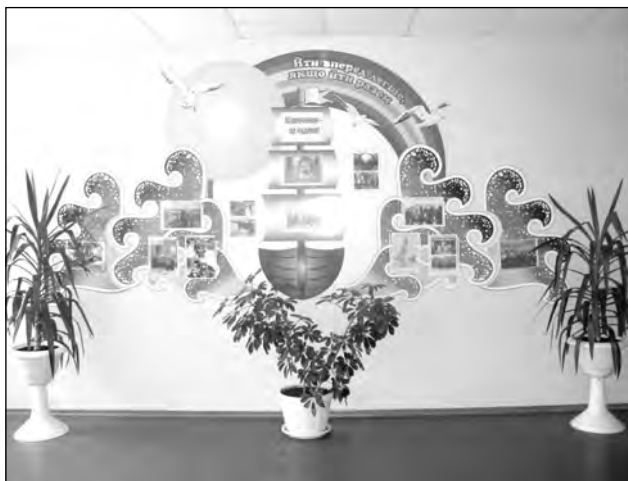
Озеленення приміщень школи

– оптимізації взаємодії з батьками школярів з питань збереження та зміцнення їхнього здоров'я.