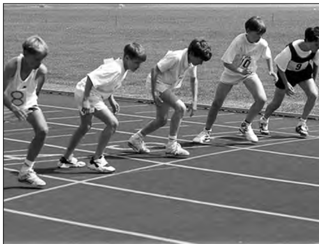
На старті змагань

методик у роботі з дітьми / О.Ю. Осадча // Вісник ХНУ імені В.Н. Каразіна. – 2008. – №799. – С.103.