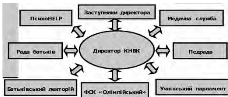
Рис. 3. Структура управління здоров'язбережувальним освітнім процесом

Удосконалення здоров'язбережувального освітнього процесу здійснюється за моделлю управлінської вертикалі – від адміністрації навчального закладу до учнівського самоврядування та батьківської громади (див. рис. 3).