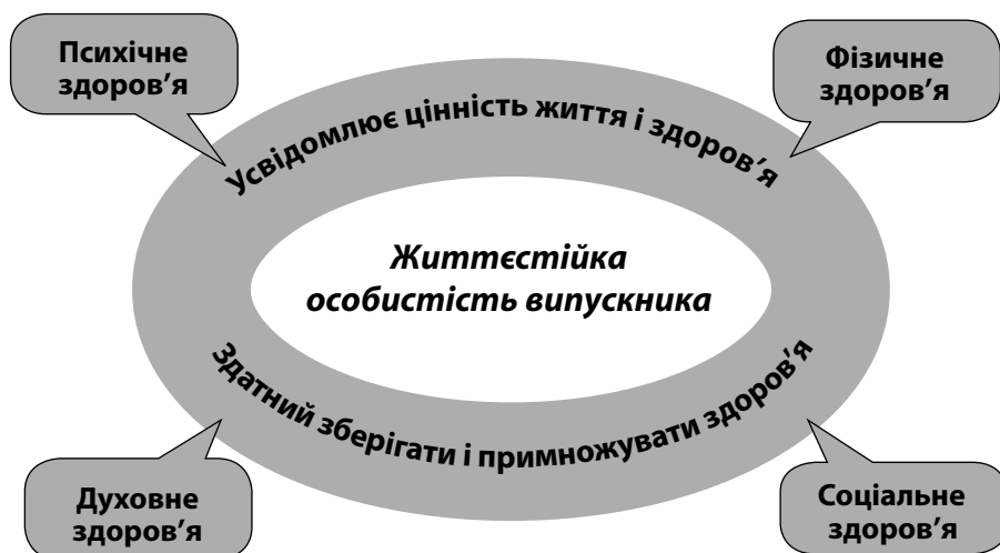
Рис. 2. Модель випускника Красноармійського навчально-виховного комплексу

У процесі створення та реалізації моделі здоров'язбережувального освітнього середовища перед керівництвом та педагогічним колективом нашого навчального закладу постали такі запитання: