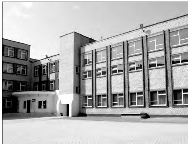
Навчальний корпус НВК

Оволодіння педагогами основами психологічних знань, ефективної взаємодії допомагає