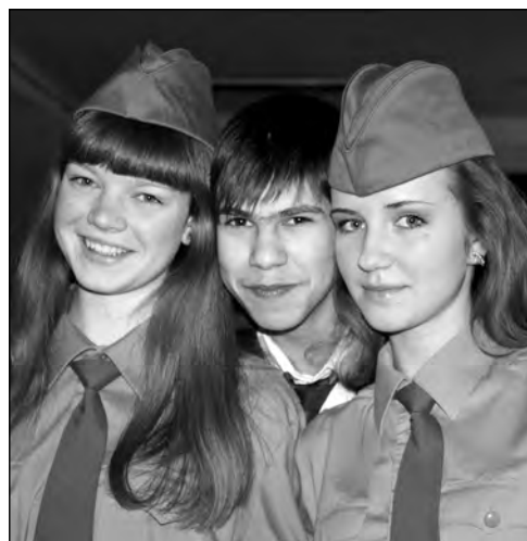
Гімназисти – учасники проектів ради старшокласників району «Намісто Роксолани», «Нащадки славетних лицарів», «А ми удвох»