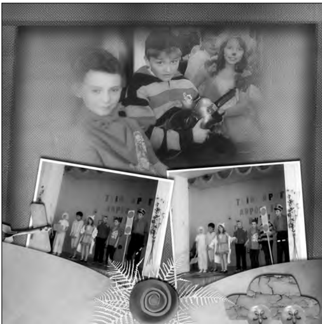
Конкурс малюнків та стіннівок «Ми – за безпеку дорожнього руху»

батькам створити програму творчого розвитку дитини. Аби кожна дитина була оточена любов'ю та увагою, навчалася жити та працювати в колективі, класні керівники готують цікаві виховні заходи, а саме: анкетування «Чим живеш, дитино?», тематичні класні години «Наша сила – в колективі», години спілкування «У родинному колі ти знайдеш тепло та розуміння», конкурси «Нас єднає колектив», «Кращий клас року» тощо.