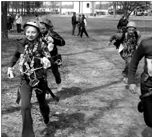
Учасники туристичних змагань «Тато, мама, я – спортивна сім'я»

академії педагогічних наук України. До складу ради входять представники законодавчої та виконавчої влади, підприємці, науковці, батьки. Анатолій Володимирович – не лише державний діяч, а й широко відомий поет-пісняр. До речі, першими виконавцями більшості створених ним пісенних творів, які стали шлягерами, були саме учні гімназії «Міленіум».