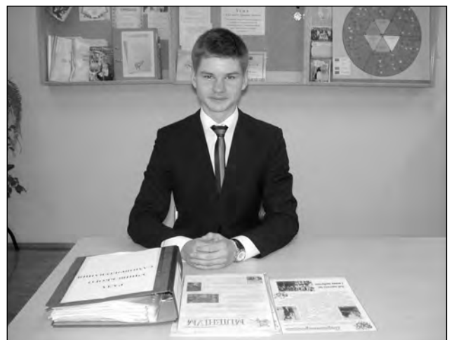
Під час конкурсу-огляду рад учнівського самоврядування «Прогнозуємо своє майбутнє»

Кожен наш учень знає свої можливості, здібності, усвідомлює, чого він може досягти. І коли є впевненість у власних силах, дитина ніколи не розгубиться у складних життєвих обставинах. У цьому