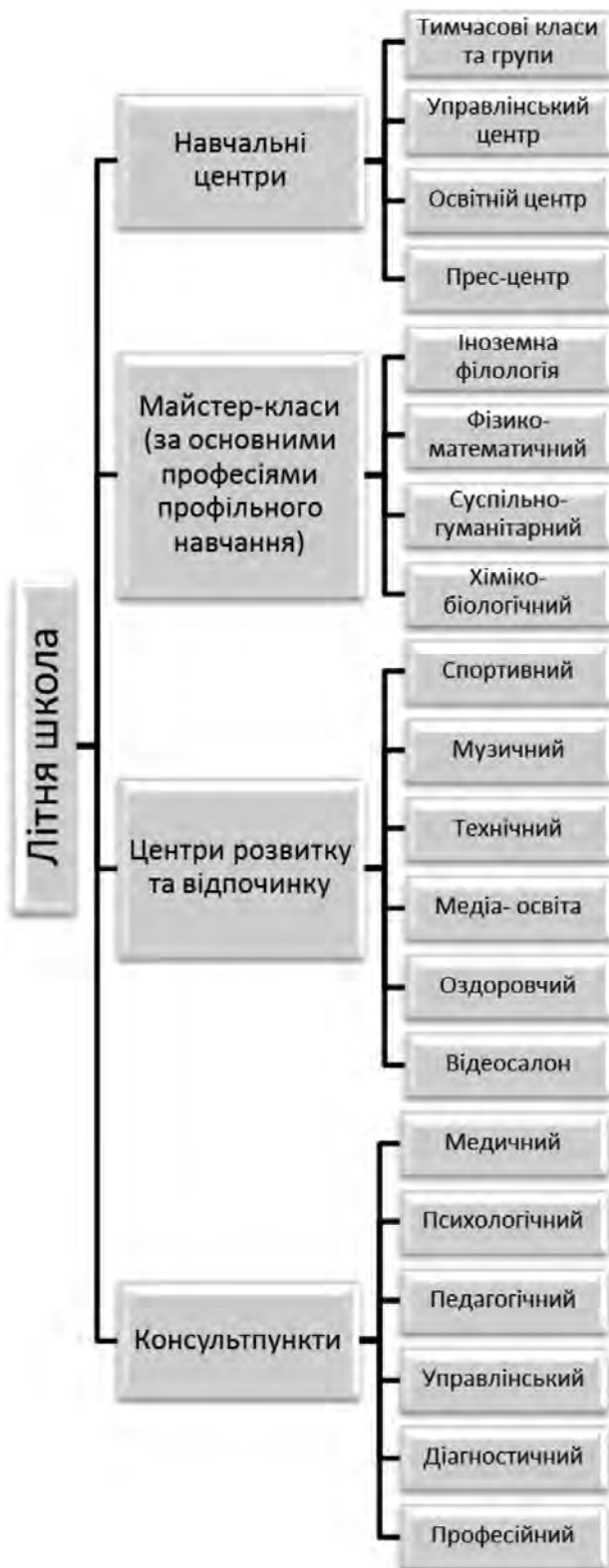
Рис. 1. Структура Літньої школи

1. Принцип гуманізації взаємин. Побудова стосунків на основі поваги та довіри до людини, на прагненні сприяти її успіху.