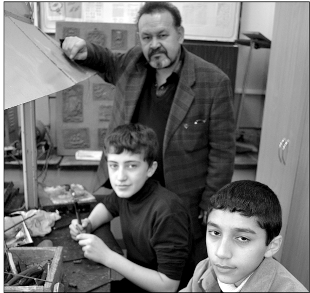
Ностальгія по Б.Окуджаве

В мастерскую войду, за собой дверь тихонько прикрою.