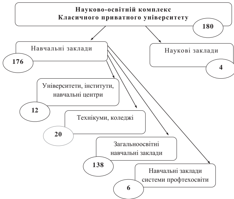
Схема 2. Структура Науково-освітнього комплексу

Рішення Ради Комплексу ухвалюються більшістю і після затвердження головою Ради є обов'язковими для керівництва Комплексу та мають рекомендаційний характер щодо конкретних закладів – членів Комплексу – і їх керівників. Ступінь участі окремих закладів у співробітництві в межах Комплексу пов'язаний, передусім, із тим, у яких з рекомендованих Радою заходах вони беруть участь.