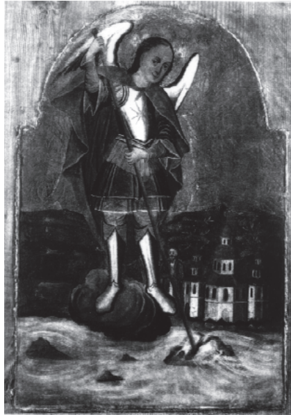
Репр.: Шедеври українського іконопису XII–XIX ст. Київ: Мистецтво, 1999. Лл. 78

вдовзі перетворилася на центр монастирського ансамблю, тим більше, що вона вишукана за формами. Не дивно, що саме цей храм почали сприймати як головний, на відміну від давнього напівзруйнованого собору. Це засвідчує стінопис Софійського собору в Києві, із зображенням Чуда архангела Михаїла, поряд з цією новою Видубицькою церквою. Живопис датують 1720-ми рр. 12 Подібна за типом споруда стоїть на березі розбурханого потоку в композиції ікони з села Щурівці. Розміщений вище церкви пагорб теж досить близько нагадує реальний київський краєвид поруч з Видубицьким монастирем. Себто, волинський маляр другої половини XVIII ст. мав з деякими відмінами відтворити київський іконописний взірєць. Міг так само поставити поруч з церквою замість традиційного ченця Архипа, що спостерігає чудо, більш звичайного за виглядом для свого часу паламаря у цивільному одязі.