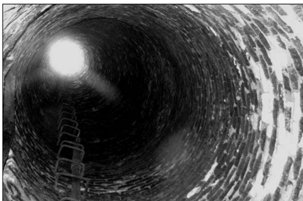
Рис. 4. Пошкоджена корозійно-механічними процесами димова труба котельні КП «Житомиртеплокомуенерго» перед ремонтом

під тиском в 100 атм у тріщини і пошкодження. Встановлено, що поліуретанова композиція повністю заповняла дефекти в бетонній матриці залізобетону, підвищувала зв'язок бетонної матриці зі сталеву арматурою та блокувала шляхи витoku і просочення ґрунтових вод через підпірну стіну до ДП «Український дім».