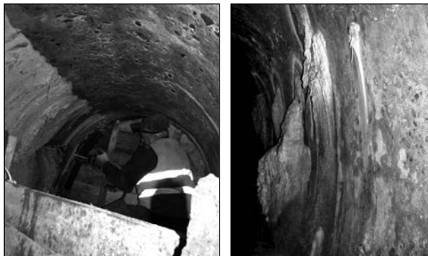
Рис. 2. Ремонт ін'єкційним способом підземного каналізаційного колектора на вул. Городоцькій у м. Львові