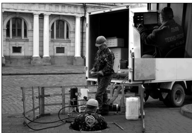
Рис. 3. Працівники пересувного діагностично-відновлювального комплексу під час проведення відновлювальних робіт на каналізаційному колекторі на проспекті Свободи біля Львівського Оперного театру