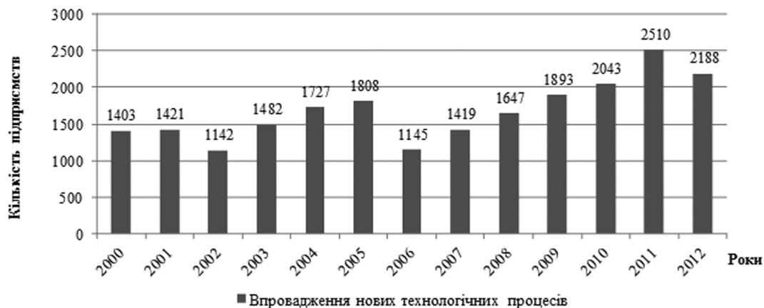
Рис. 1. Динаміка впровадження інновацій на промислових підприємствах України за період 2000–2012 рр.