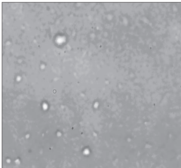
Рис. 2. Мікрофотографія проби з об'єму суспензії, отриманої в диспергаторі-гомогенізаторі із зразка набряклого в дистильованій воді насіння сої (збільшення \times 148 )

Дані табл. 11 вказують на відтворюваність результатів лабораторних дослідів за основни-