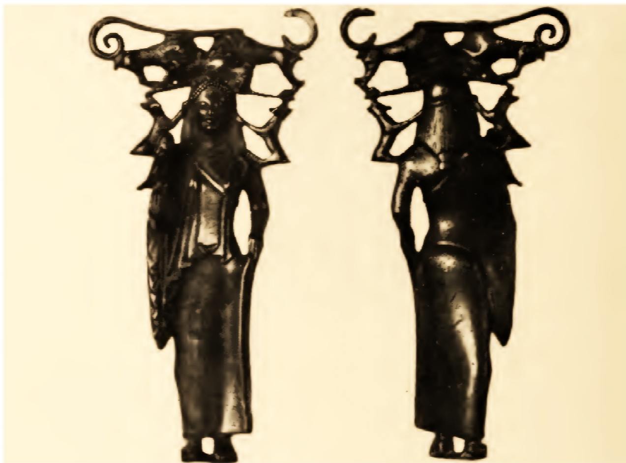
Фото 3. Бронзова ручка дзеркала у формі статуетки з Херсонського кургану.