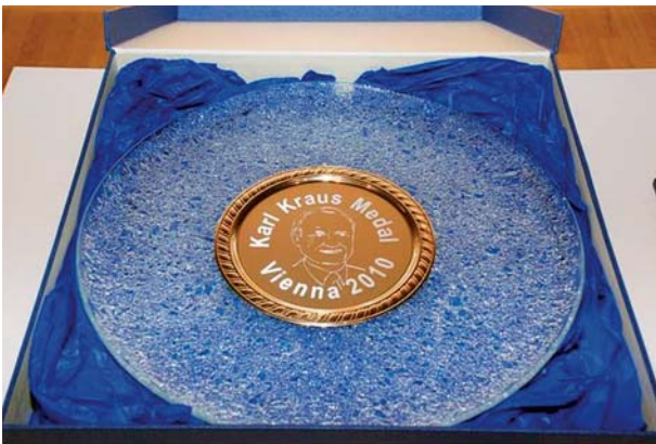
Медаль ім. проф. Карла Крауса