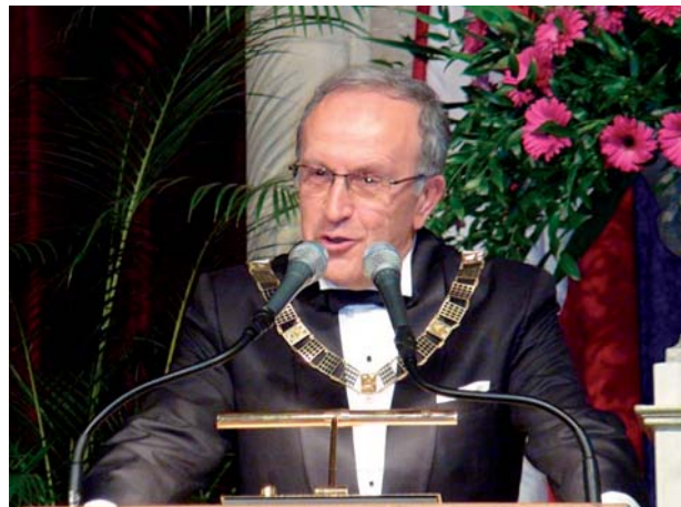
Виступ Президента ISPRS професора Орхана Алтана