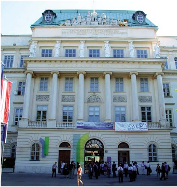
Головний корпус Віденського технологічного університету