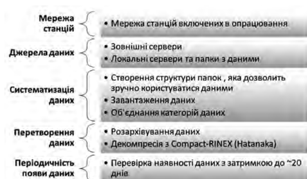
Рис. 2. Структура підготовчого етапу

Збір та систематизація файлів складається з чіткої послідовності виконання дій (рис. 2), що в підсумку реалізує підготовчий етап.