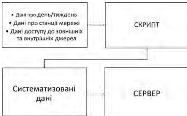
Рис. 4. Алгоритм роботи скрипта

Підготовчий етап опрацювання GNSS-спостережень реалізований на скриптографічній мові програмування PHP та впроваджений на сервері під управлінням UNIX (рис. 4).