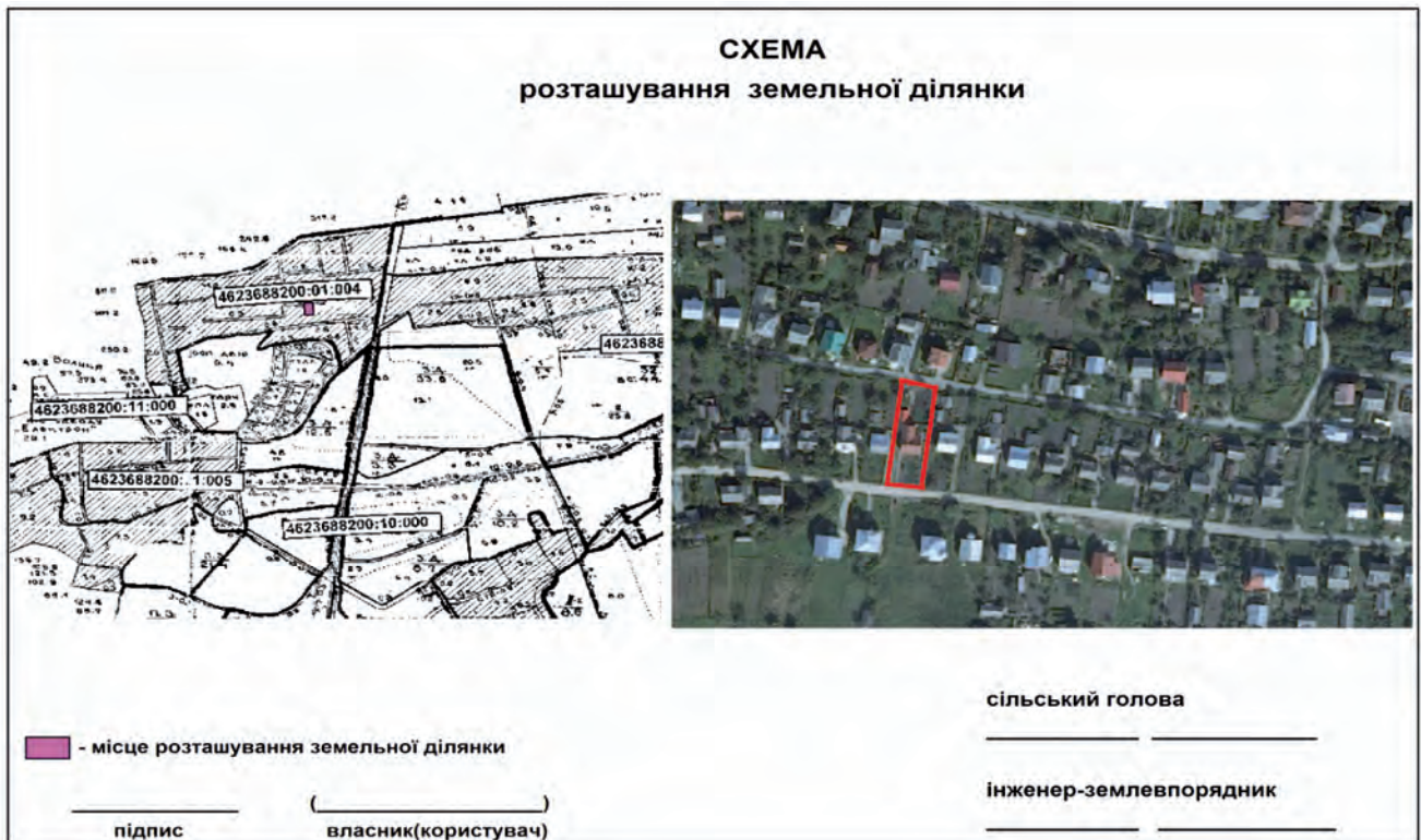
Рис. 2. Запропонована схема розташування земельної ділянки