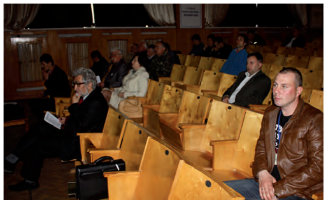
На секції “Фотограмметрія, картографія, ГІС”