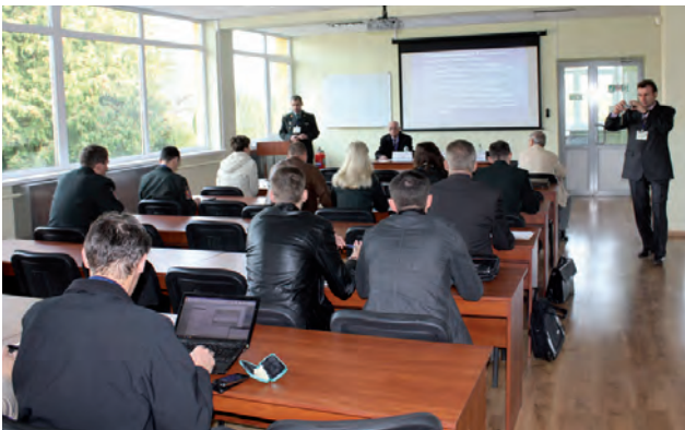
На секції “Військові геодезичні та GIS-технології”