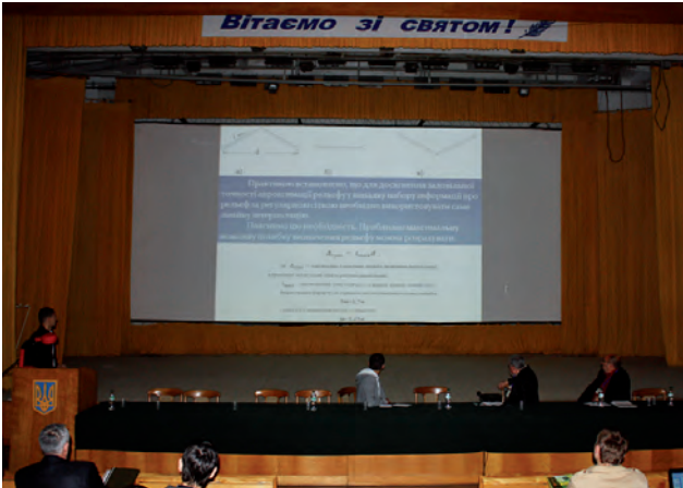
На секції “Інженерна геодезія, геодезичний моніторинг у будівництві”