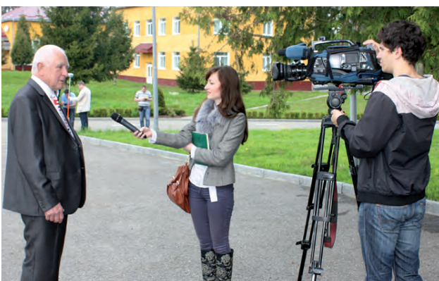
Інтерв'ю Президента УТГК І. Тревозо