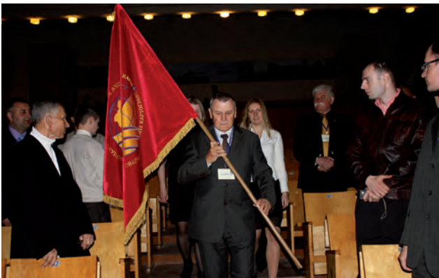
Внесення прапора УТГК