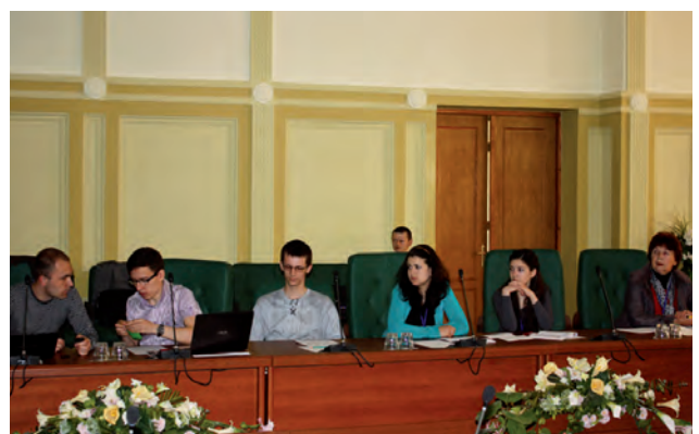
Молоді вчені на секційному засіданні