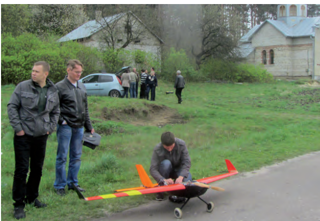
Підготовка БПЛА до запуску у с. Верецьця

Проблемні питання інженерно-геодезичних задач висвітлив у своїй доповіді доц. К. Бурак (Івано-Франківськ). Сучасний підхід до створення системи містобудівного кадастру розкрито у доповіді проф. А. Лященко (Київ). Представники чеської делегації М. Коцаб і К. Радей зробили доповідь про підготовку географічної бази даних та кадастрових карт міста. Доктор Л. Томас (Німеччина) доповів про останні розробки з використання фотограмметричних технологій у медицині.