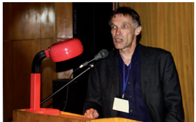
Доповідь Т. Люмана (Німеччина)