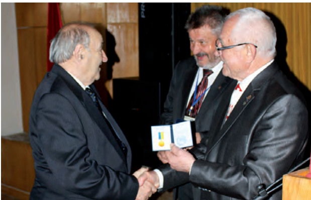
Нагородження професора Романа Пилиюка