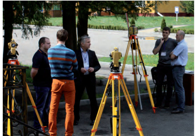
На презентації сучасних приладів і технологій