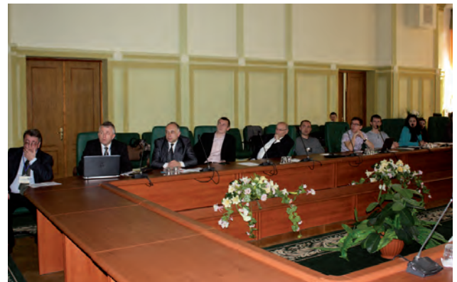
На секції "Геодезія, геодинаміка, моніторинг"