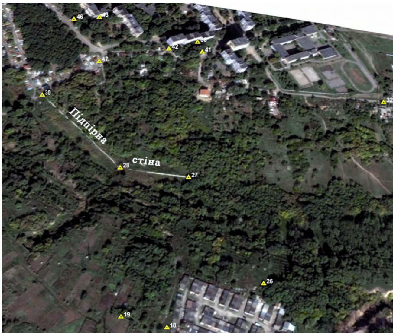
Рис. 2. Схема розміщення наявних пунктів станції спостереження на ділянці "Сокіл" (весна 2015 р.)