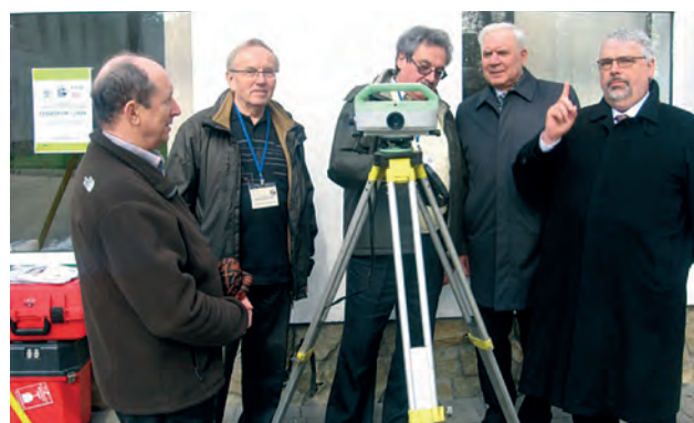
На виставці сучасного геодезичного обладнання