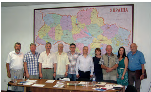
Засідання правління УТГК