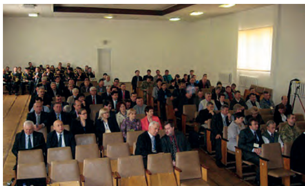
Відкриття МНТК "Геофорум-2016"