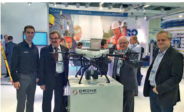
Делегація УТГК на конгресі INTERGEO (Німеччина)