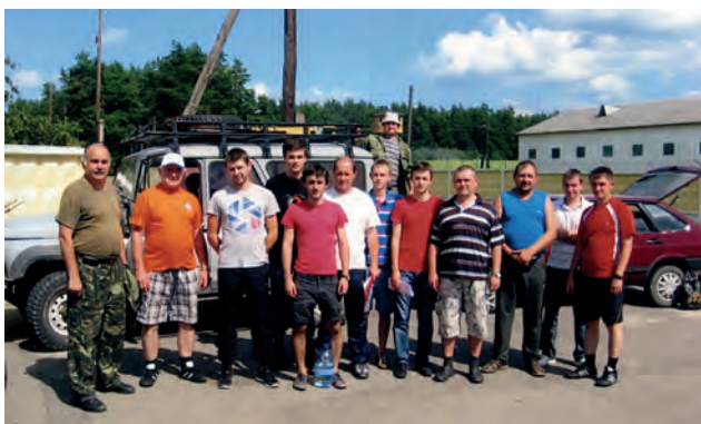
Під час наукової експедиції на НПП (Яворів)