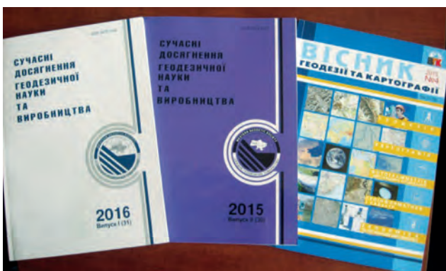
Видавнича діяльність УТГК