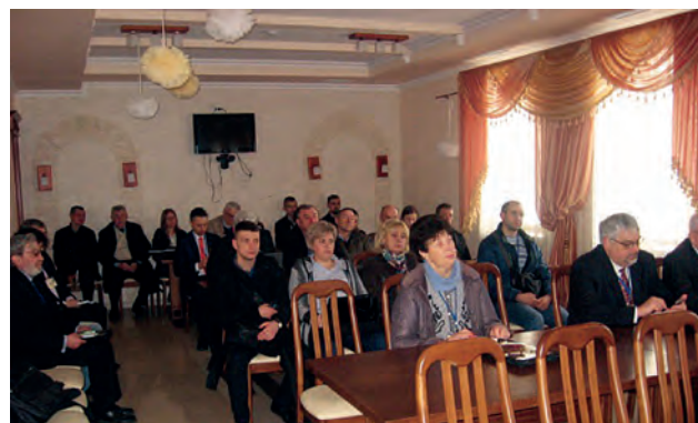
На секційному засіданні МНТК "Геофорум-2016"