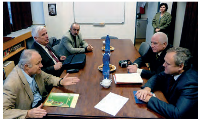
На переговорах делегації УТГК у Чехії