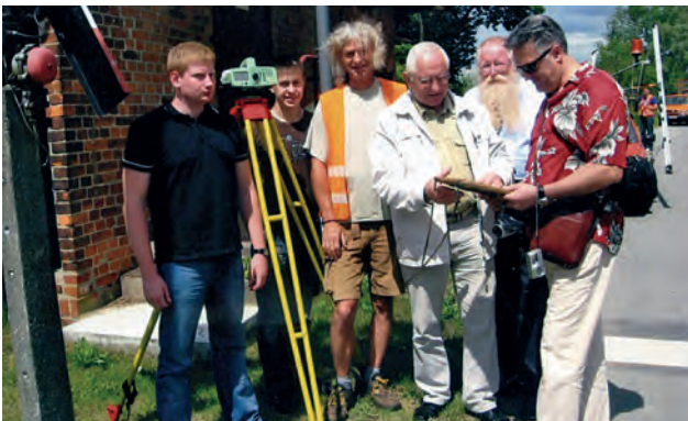
Проведення наукових досліджень у м. Нойнбрандербург