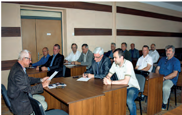
На засіданні правління Західного геодезичного товариства УТГК