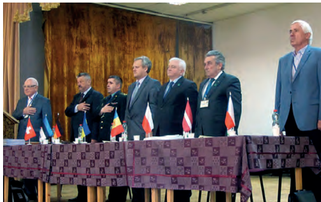
Президія МНТК "Геофорум" під час відкриття конференції