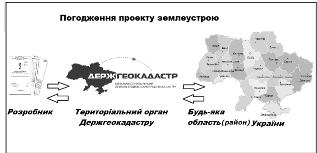
Рис. 1. Схема погодження проекту землеустрою

Вирішенням проблеми таких частих відмов у погодженні проекту землеустрою може бути створення еталонного проекту землеустрою щодо відведення земельної ділянки, у якому би зазначалися усі вимоги для створення повноцінного проекту. Це, звісно, дуже складно зробити, тому що під час розроблення такого еталонного проекту потрібно врахувати всі нюанси. Для цього необхідно об'єднати інформацію з чинних законів, постанов, інструкцій.