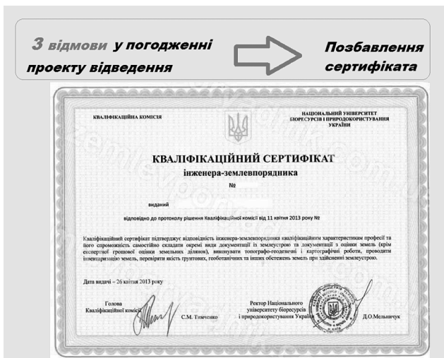
Рис. 4. Наслідки відмов у погодженні проекту відведення