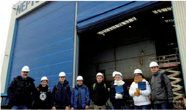
На науково-виробничій фірмі