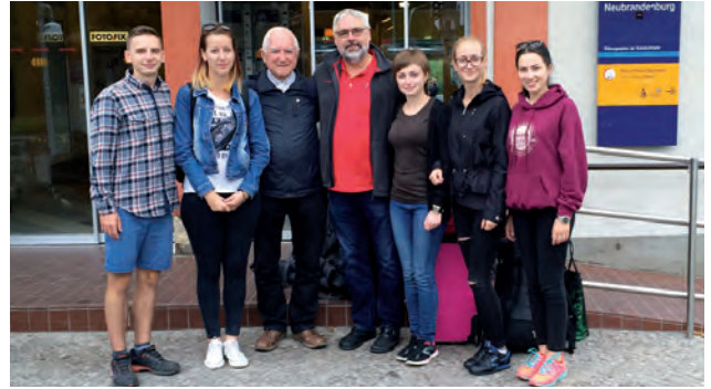
Фрагмент зустрічі нової групи студентів ІГДГ

З першого навчального дня українські магістри розпочали інтенсивне вивчення німецької мови на спеціальних практичних заняттях з метою адаптації у німецьке мовне та культурне середовище.