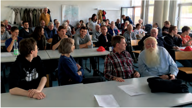
На науковому семінарі