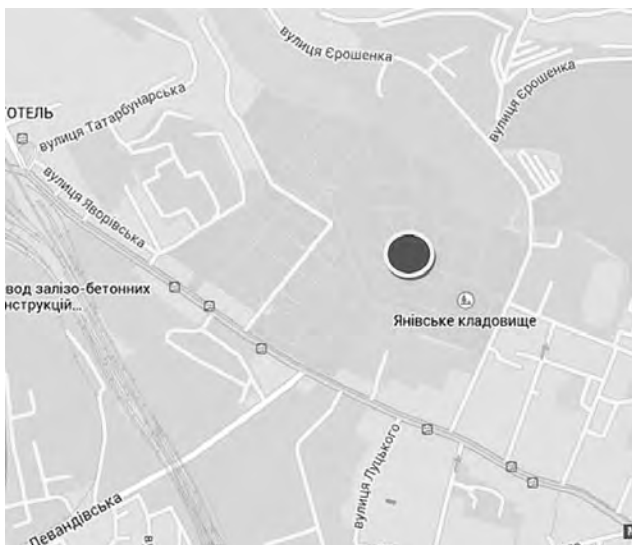
Рис. 1. Схема розташування Нового єврейського кладовища у Львові

Територія кладовища обмежена частиною (155 м) проїжджою вул. Єрошенка від вул. Шевченка та 195 м територією ПАТ “Львівгаз” зі сходу, схилом та гаражним кооперативом з півночі, кварталом промислових будівель ПП “Знак якості” 150 м від вул. Єрошенка, ще на 95 м промисловими будівлями “Азов-Галичина” з півдня та християнським цвинтарем із заходу (рис. 1).