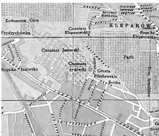
Рис. 2. Фрагмент польської карти Львова 1938 р.

Вхідними матеріалами для досліджень слугували: