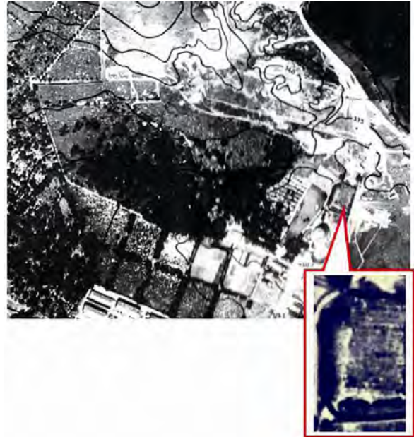
Рис. 6. Архівний аерознімок 1934 р. з вказаним місцем поховань єврейських воїнів, що загинули у 1914–1918 рр. (15 рядів могил, в кожному з яких не менше від 23 поховань)

За отриманими даними створено два графічні документи масштабу 1:1000 на форматі A2. На них відтворено початкову межу кладовища в межах сучасної містобудівної ситуації та всі її зміни з часом (рис. 7, 8).