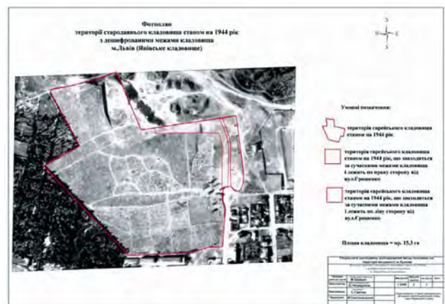
Рис. 7. Фотоплан території єврейського кладовища у 1944 р. з дешифрованими межами кладовища