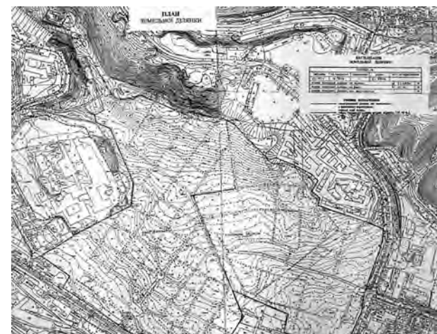
Рис. 5. Сучасний топографічний план території Янівського кладовища у Львові