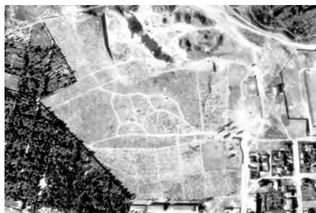
Рис. 4. Архівний німецький аерознімок 1944 р.