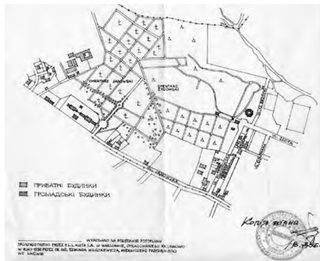
Рис. 3. Польський план території кладовища 1936 р.