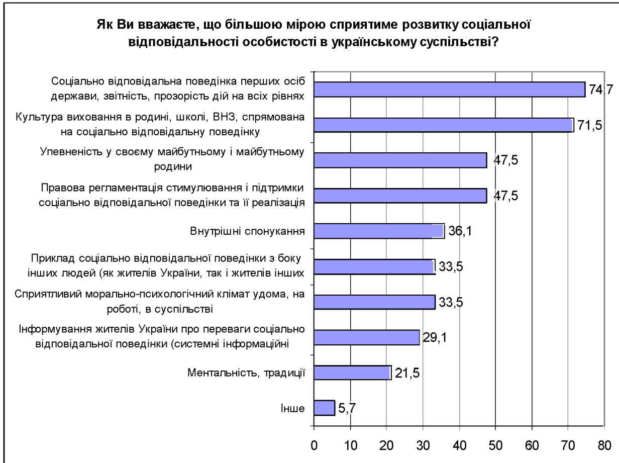
Рис. 2. Оцінка експертами факторів, що сприяють розвитку соціальної відповідальності особистості в українському суспільстві, %

Серед перешкод у становленні соціальної відповідальності особистості також простежується висока вагомість таких, що спричиняють недоліки державного управління, а саме: соціальна несправедливість, високий рівень і наростання майнової диференціації в суспільстві при низькому рівні та якості життя населення України (72,8%), низький рівень духовно-моральної культури владної еліти, суспільства і бізнесу (52,5%), укорінення тіншових відносин у трудовій сфері (37,3%), низький рівень правової культури (34,2%), відсутність системних інформаційних кампаній щодо пропаганди соціально відповідальної поведінки (23,4%).