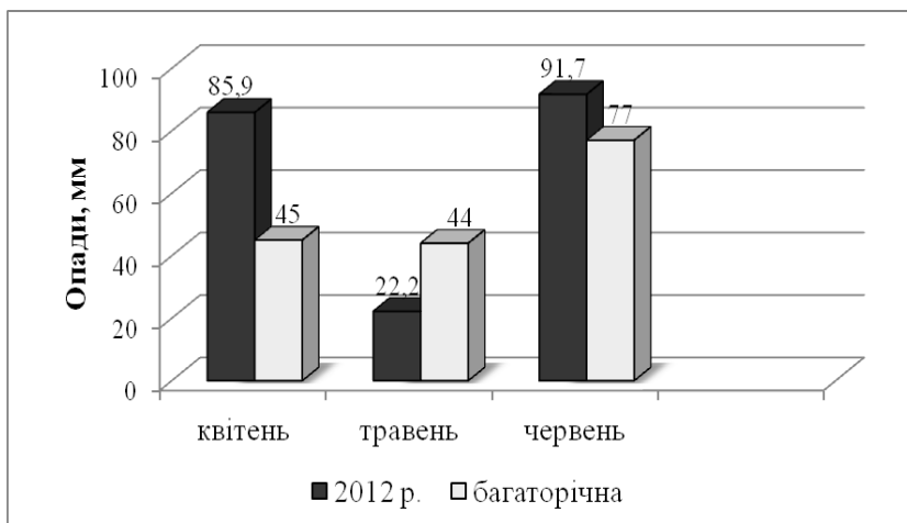
Рис. 2. Кількість опадів за квітень-червень відносно до середньо-багаторічного показника, 2012 р.

У квітні максимальна температура повітря сягала + 30,4 °С. ГТК з квітня по червень становив 1,3, що свідчить про достатнє зволоження для розвитку листових хвороб. У квітні був підвищений температурний режим з надмірною кількістю опадів (191 % від норми).