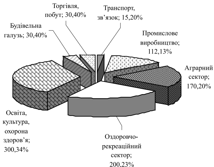
Рис. 3. Структура зайнятості населення селищної ради Великого Любена (За власними розробками)

Однак, після останньої реорганізації вітчизняних спиртових заводів та об'єднання їх у єдину структуру, його діяльність значно ускладнилась, в першу чергу, за рахунок централізації управління, яка не дозволяє самостійно приймати рішення «на місцях» і доволі часто призводить до перебоїв у виробничому циклі. Не виключеною є також поступова ліквідація заводу.