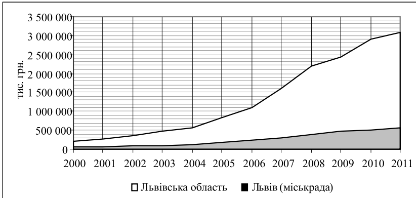
Рис. 2. Обсяги видатків на освіту з місцевих бюджетів у Львівській області та м. Львові, 2000-2011 рр. (Складено автором на основі джерела: [4])

використання бюджетних коштів, або ж про значні втрати людського капіталу через міграційні процеси.