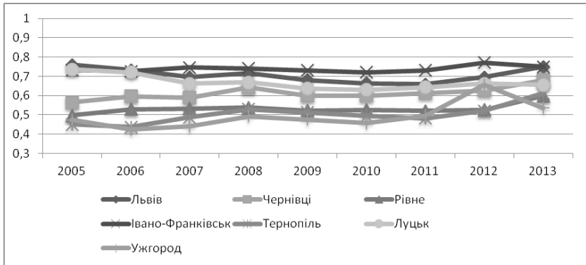
Рис. 2. Динаміка реалізації метрополійної соціально-демографічної функції в містах-обласних центрах Західного регіону України

Бровари, Вишневе, Львів – Брюховичі, Солонка, Соکیلники, Білогорща, С. Ременів, С. Зимна Вода, С. Скнилів тощо).