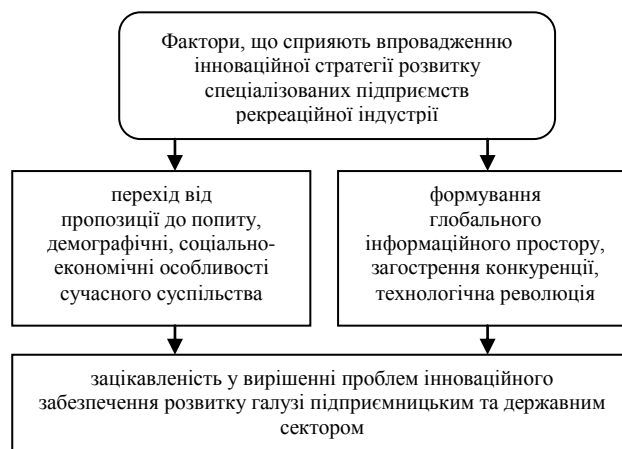
Рис. 1. Фактори, що сприяють впровадженню інноваційної стратегії розвитку спеціалізованих підприємств рекреаційної індустрії*

і освоюють усередині підприємства його спеціалізовані підрозділи шляхом планування та моніторингу їхньої взаємодії за інноваційним проектом;