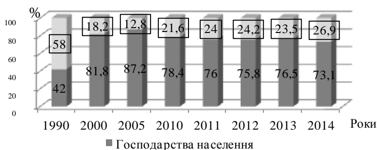
Рис. 1. Структура виробництва валової продукції сільського господарства в Чернівецькій області

В Чернівецькій області до початку аграрної реформи господарства населення забезпечували виробництво валової продукції сільського господарства на 42% від загального результату всіх категорій господарств, а сільськогосподарські підприємства – на 58% (рис. 1).