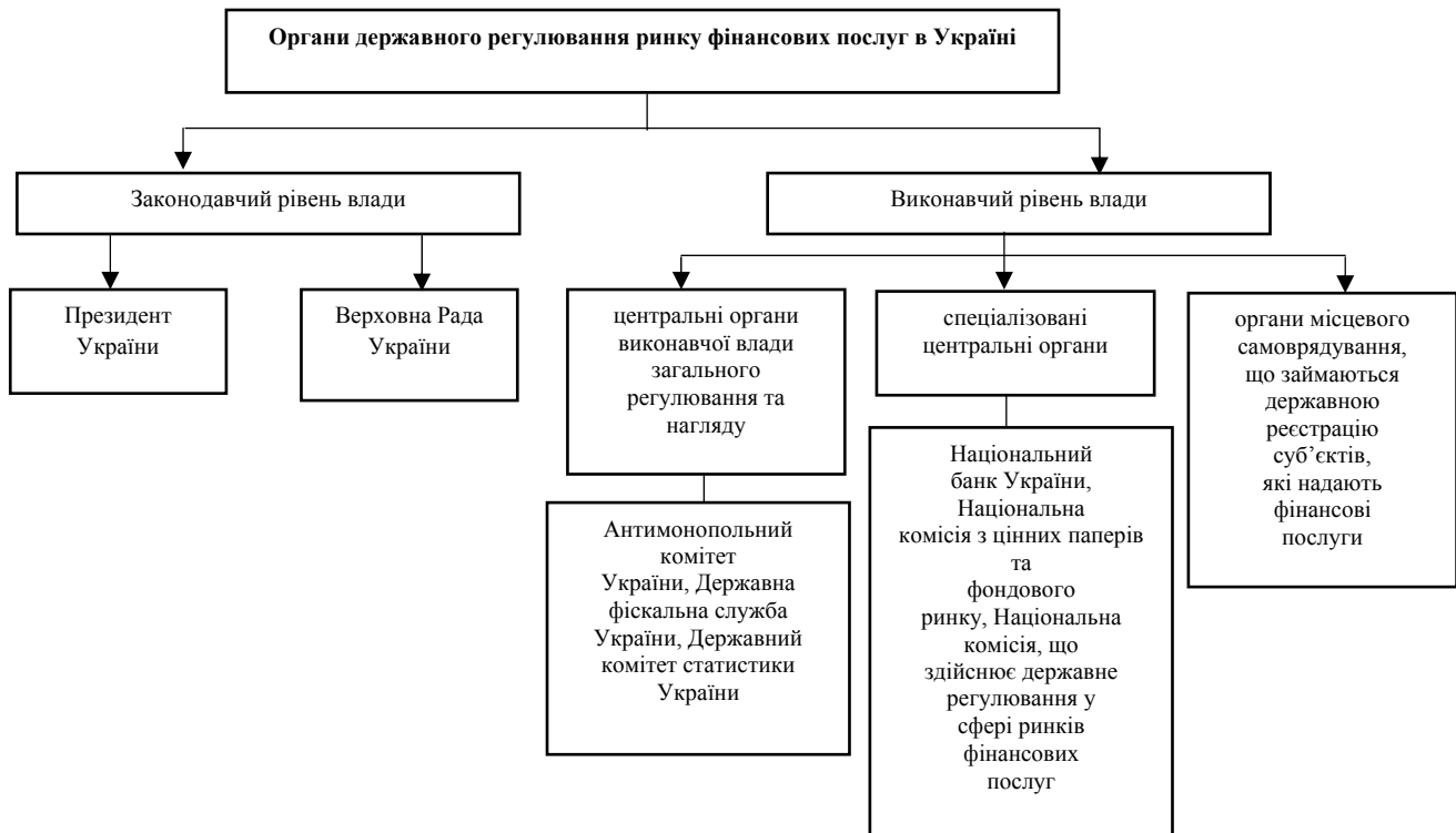
Рис. 1. Структура органів державного регулювання ринку фінансових послуг в Україні

Існуюча система регулювання ринку фінансових послуг в Україні давно потребує комплексного реформування, тому у 2015 р. здійснено важливий крок у цьому напрямі – затверджено Комплексну програму розвитку фінансового сектору України до 2020 року. Основні етапи реалізації Програми наведено на рис. 2 [4].