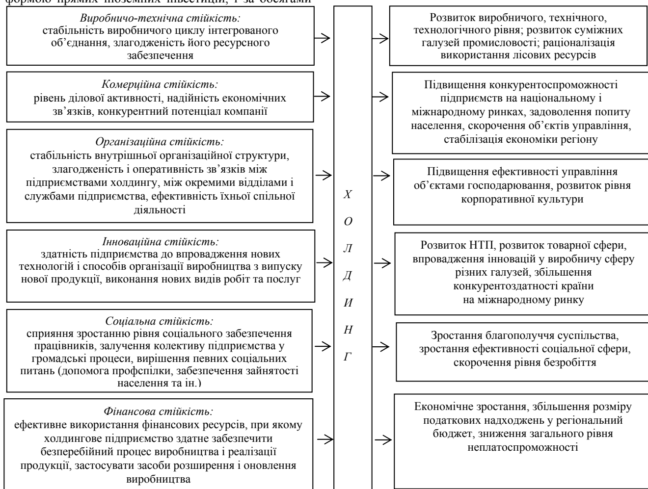
Рис. 1. Вплив економічної стійкості холдингової структури на розвиток економіки регіону

залучених коштів вони значно випереджають інвестиції у нові підприємства [12].