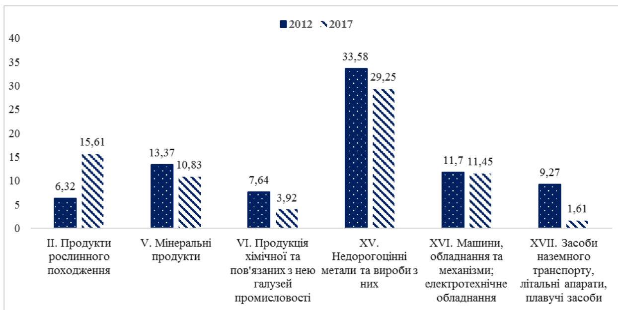
Рис. 2. Структура товарного експорту України (за основними товарними групами), % Побудовано за даними Державної служби статистики України [4].

Київської області (23,25%), тоді як у 2012-му – Волинської (9,8%); продукти рослинного походження – стабільно у товарній структурі експорту Миколаївської області (55,29% проти 44,62% у 2012 році); жири та олії – у товарній структурі експорту Вінницької області (37,26%), а у 2012 році – Кіровоградської (34,68%); готові харчові продукти – у товарній структурі експорту Харківської області (24,53%), а у 2012-му – Херсонської (17,12%).