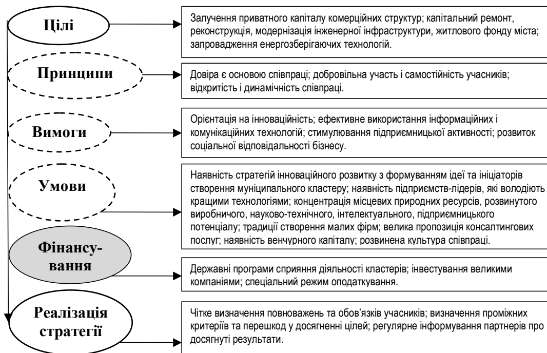
Рис. 1. Засади функціонування муніципального кластеру

суб'єктів та поведінці кластера в цілому. Інструментом ліквідації негативних впливів виступає стратегічне управління, яке виступаючи як багатоплановий процес, допомагає не тільки формулювати та виконувати ефективні стратегії, а й сприяє балансуванню і корегуванню відносин між учасниками кластеру та зовнішнім середовищем для досягнення цілей.