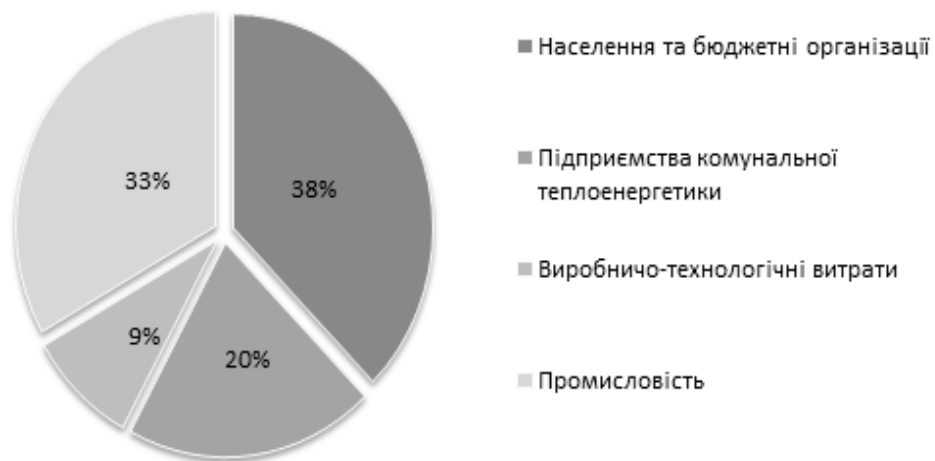
Рис. 2. Структура споживання природного газу в 2015 році [8]

Найефективнішою реакцією на сучасні виклики та загрози в енергетичній сфері для України мають стати радикальні структурні реформи в усіх напрямках енергетичної політики з метою підвищення енергоефективності, формування конкурентних енергетичних ринків, диверсифікації енергопостачання, збіль-