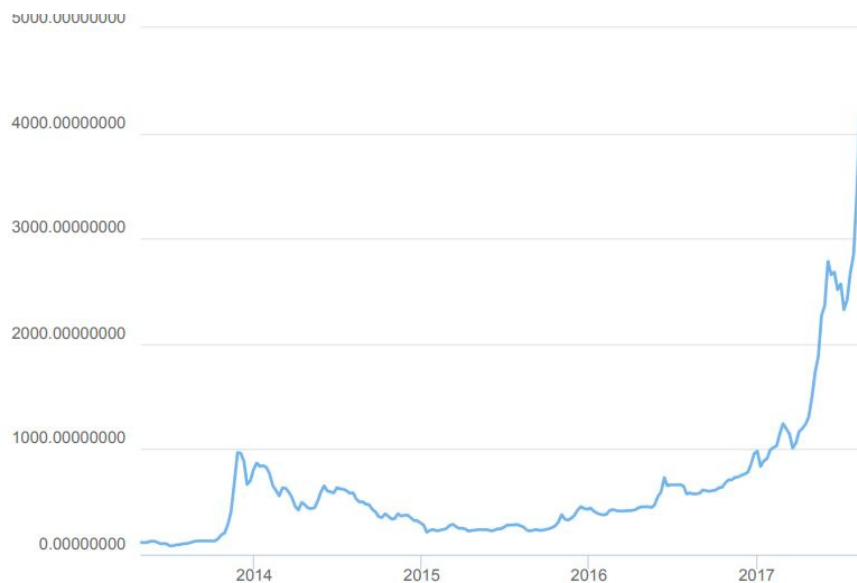
Рис. 3. Динаміка курсу біткоіна в 2014–2017 рр.

За умови використання криптовалюти перед менеджерами підприємства постає нова задача — відстеження змін у попиті та пропозиції електронних грошей, адже, як уже зазначалося, курс даної валюти залежить саме від їх взаємодії та постійно змінюється, зазнає як різких підйомів до рекордних значень, так і падінь до своїх мінімумів (рис. 3).