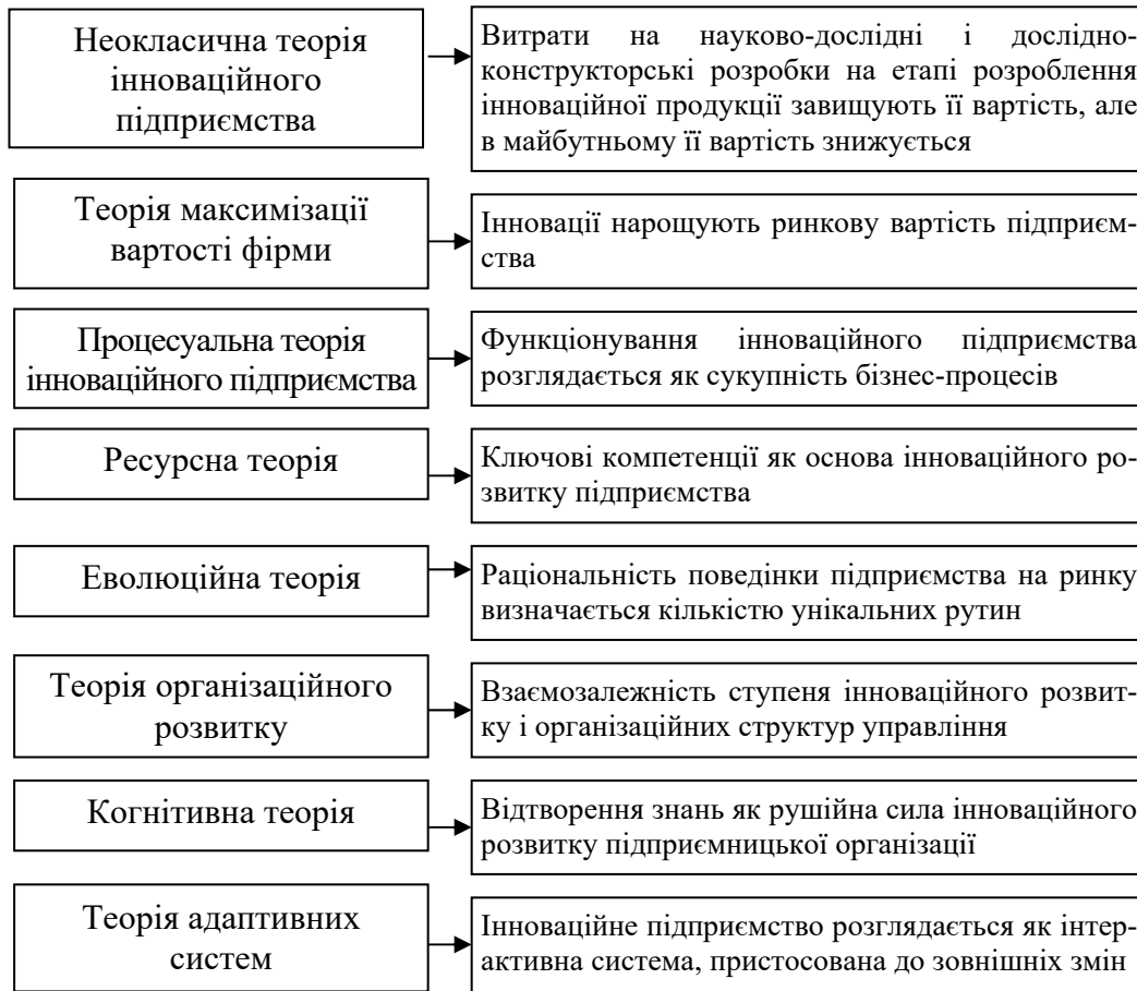
Рис. 1. — Основні положення теорій інноваційного підприємства*

В умовах глобалізації практичну направленість мають теорії інноваційного підприємництва (рис. 1).