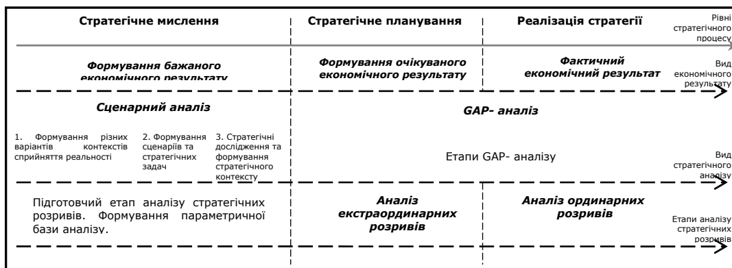
Рис. 2. Формалізація розширення змістовних контурів аналізу стратегічних розривів підприємства