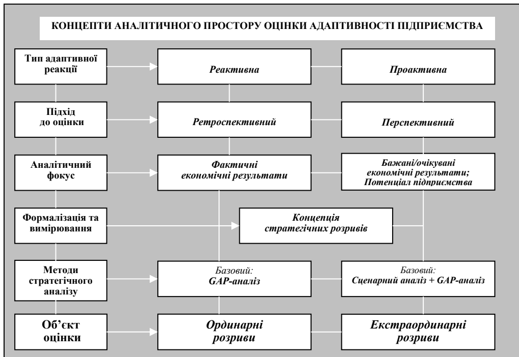
Рис. 3. Концепти аналітичного простору оцінки адаптивності за постіндустріальних умов діяльності підприємства

Висновки. В цілому, узагальнюючи наведені авторські міркування можна визначити концепти аналітичного простору оцінювання адаптивності, які віддзеркалюють специфіку оцінок за постіндустріальних умов діяльності підприємства (рис. 3) та надають такі відмінні особливості пропонованому методичному підходу: