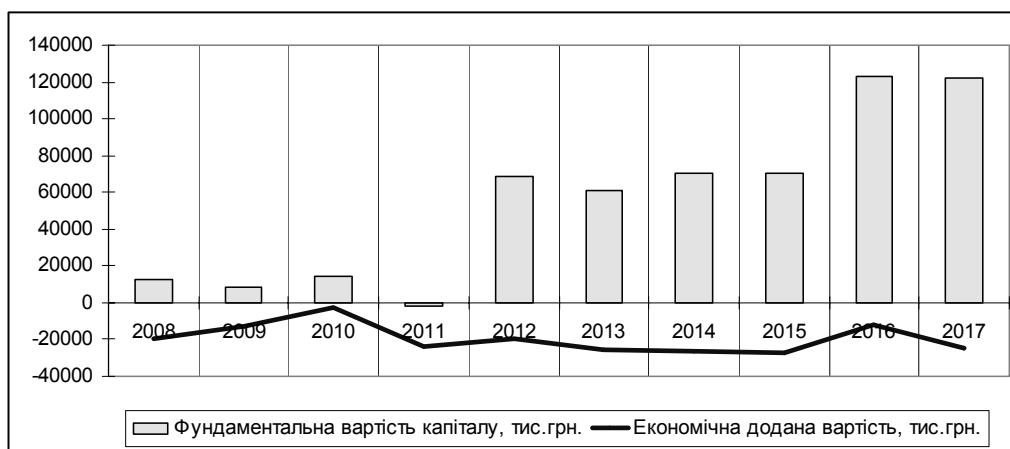
Рис. 2. Показники фундаментальної вартості капіталу та економічної доданої вартості ПрАТ «Козятинський м'ясокомбінат» у 2008—2017 рр.

Аналіз адаптації конкретних вітчизняних харчових підприємств до змін, що відбуваються у зовнішньому середовищі, дозволяє зробити такі узагальнення. Сьогодні наявність сучасної техніко-технологічної бази для харчових підприємств є обов'язковою, але не достатньою передумовою забезпечення ефективності їх діяльності та конкурентоспроможності. Так, наприклад, ПрАТ «Козятинський м'ясокомбінат» має техніко-технологічну базу, яка відповідає західним стандартам виробництва, протягом останніх восьми років є прибутковим, фундаментальна вартість капіталу за останні десять років зростає майже у 10 разів (рис. 2), при цьому, підприємство генерує лише від'ємні потоки економічної доданої вартості бізнесу, торговельна марка підприємства FOODWORK є майже невідомою вітчизняному споживачеві, фізичні обсяги виробництва мають спадну динаміку, асортимент продукції протягом останніх років майже не змінився.