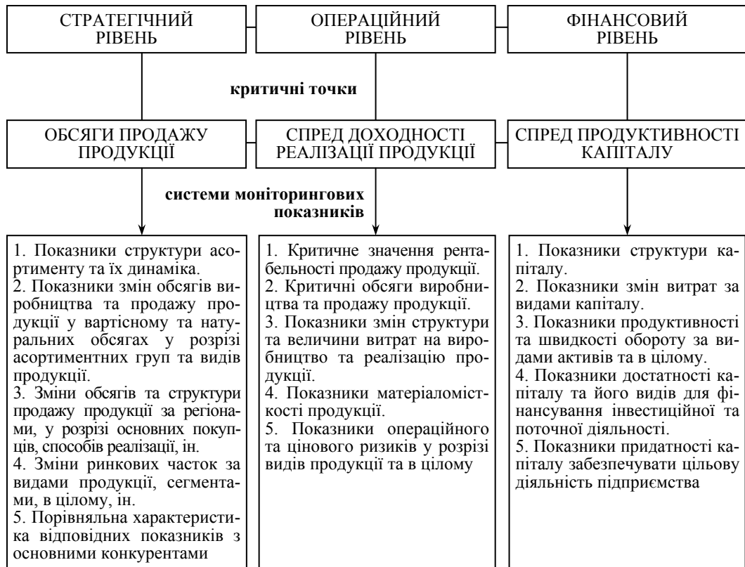
Рис. 3. Система критичних точок і моніторингових показників оцінювання адаптації харчових підприємств

Якщо говорити про систему критичних точок, в аспекті аналізу рівня адаптації харчових підприємств, то їх умовно можна представити у єдності взаємозв'язку таких аспектів: обсяги виробництва та продажу продукції; спред доходності реалізації продукції, спред продуктивності капіталу. Відповідно до змісту кожного з визначених аспектів формується система моніторингових показників, які є інформативними з точки зору аналізу причинно-наслідкових зв'язків, що впливають на зміни базових індикаторів (рис. 3).