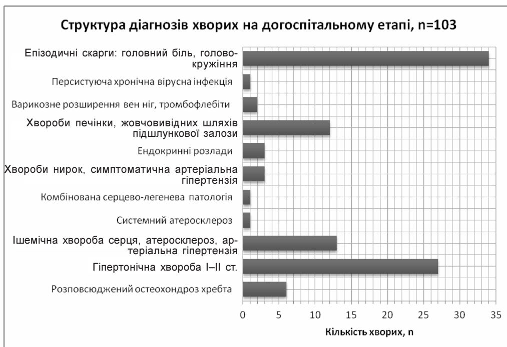
Рис. 3. Структура діагнозів хворих на догоспітальному етапі амбулаторного лікування.

За даними таблиці 1, видно, що такі хвороби, як ішемічна хвороба серця, атеросклероз, артеріальна гіпертензія, гіпертонічна хвороба, хвороби ни-