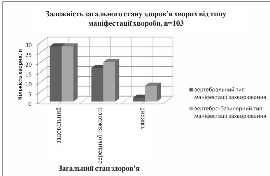
Рис. 1. Залежність загального стану здоров'я хворих із порушенням кровотоку в ВББ від типу маніфестації захворювання.

67 (65 %) пацієнтів висловлювали занепокоєння з цього приводу. Перш за все була помітна деяка клінічна специфічність цього симптому, що полягала в його пароксизмальності, зв'язку зі зміною положення голови чи тіла, переважною короткочасністю та наявністю відчуття нудоти в кінці нападу, що свідчило про його вертеброгенне походження. Напади головокружіння в основному мали характер несистемних, з'являлись різко і зникали за декілька секунд. Лише у 13 (12,6 %) хворих вони тривали більше 30 хв (а подекуди і до 1 год) за типом меньєрівських, проте без подальшого розвитку кохлеарних порушень.