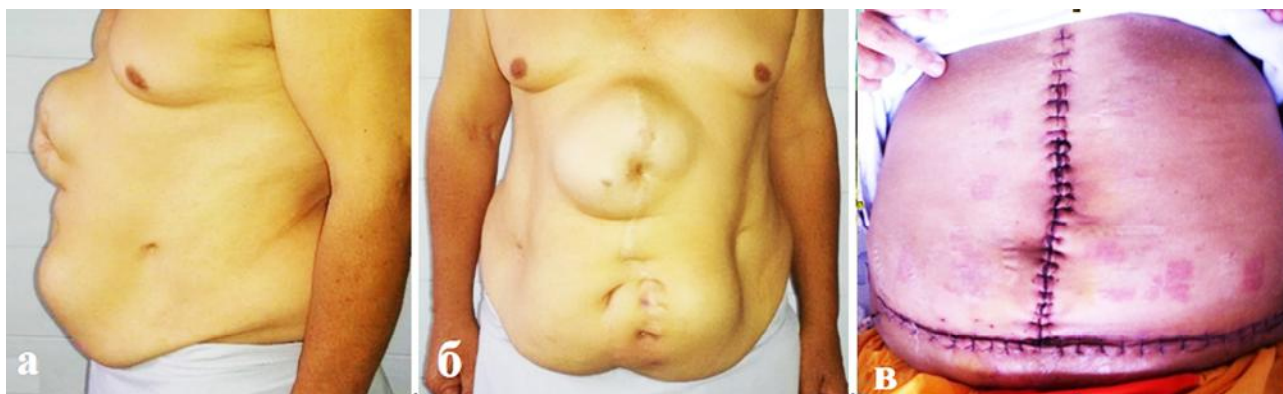
Рис. 2: а, б – пациент К., 54 года, до операции с диагнозом послеоперационная вентральная грыжа; в – после пластики “onlay”.

с высоким риском сердечно-сосудистых заболеваний и сахарного диабета 2 типа, претерпевает существенные изменения.