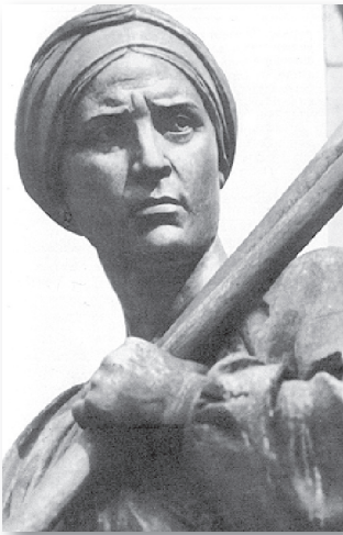
Фрагменти пам'ятника Т. Шевченку в Харкові: Катерина, Жінка-селянка. Скульптор Матвій Манізер. 1935.