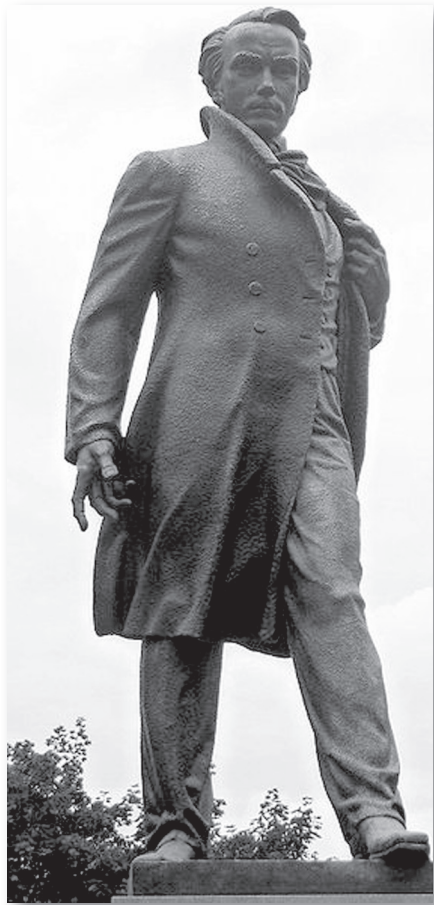
Пам'ятник Т. Шевченку у Вашингтоні. Скульптор Лео Мол. 1964.