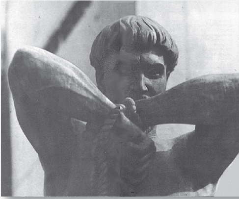
Фрагменти пам'ятника Т. Шевченку в Харкові: Той, що рве пута. Скульптор Матвій Манізер. 1935.

котрі своєю творчістю не викликали роздратування ідеологічно пильної критики, а отже, могли претендувати на премію. На черзі стояли Платон Воронько, Кость Гордієнко, Микола Ушаков, Вадим Собко, Олекса Коломієць, Дмитро Луценко, Любомир Дмитерко – вони й дочекалися цього удостоєння. Але популярність письменників-шістдесятників була вже такою широкою, усеукраїнською, до того ж їх активно друкували в Москві, що далі ніяк не можна було ігнорувати Дмитра Павличка, Івана Драча, Євгена Гуцала, Бориса Олійника, Ліну Костенко, Володимира Дрозда, Віталія Коротича, Романа Іваничука... Але відзначати когось із цих бунтівливих, непередбачуваних, творчість яких ніяк