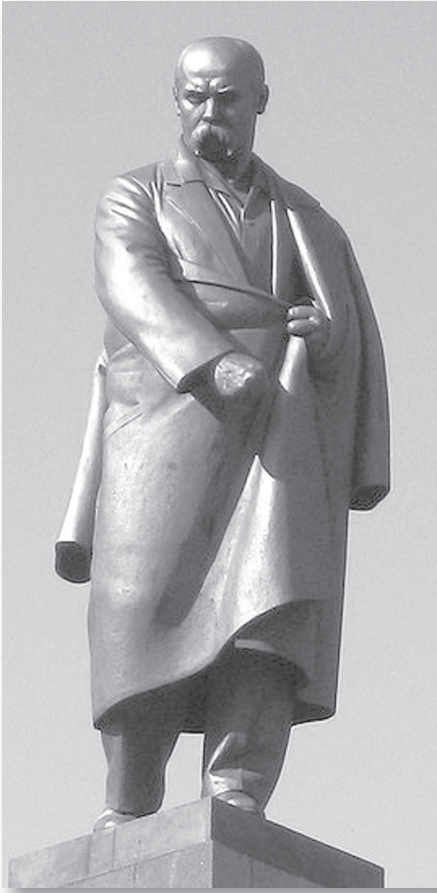
Фрагменти пам'ятника Т. Шевченку в Харкові. Скульптор Матвій Манізер. 1935 р.

Я не раз гортав ту “Пропам’ятну книгу”, на сторінках якої знаходимо тисячі-тисячі прізвищ жертводавців, переважна більшість тих, хто видав по одному-два долари, і думав про те, яких клопотів, яких проблем завдали ініціатори постанови пам’ятника Шевченкові у столиці США тодішньому керівництву СРСР. Ясна річ, комуністична влада знала, що за три роки до відзначення 100-річчя від дня смерті Тараса Шевченка XXIV Конвенція Українського Народного Союзу в США доручила своїй управі розпочати підготовку до встановлення пам’ятника Шевченкові у Вашингтоні. Це питання розглядалося в комісіях і підкомісіях Конгресу США. Була підготовлена відповідна резолюція, прийнята Конгресом Сполучених Штатів Америки та одностайно схвалена Сенатом 31 серпня 1960 р. 13 вересня 1960 р. Президент США Дуайт Д. Айзенхауер підписав цю резолюцію й вона набула статусу закону.