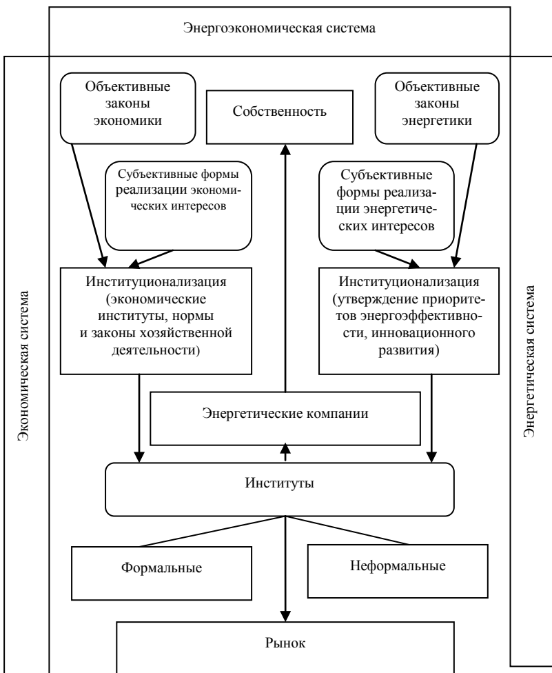
Рис. 3. Схема институционализации взаимоотношений субъектов энергоэкономической системы